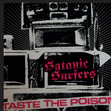
Satanic Surfers Taste the poison