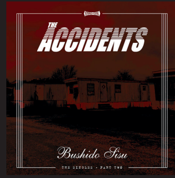
The Accidents Bushido sisu