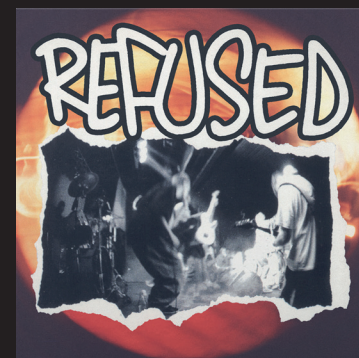
Refused Pump the Brakes