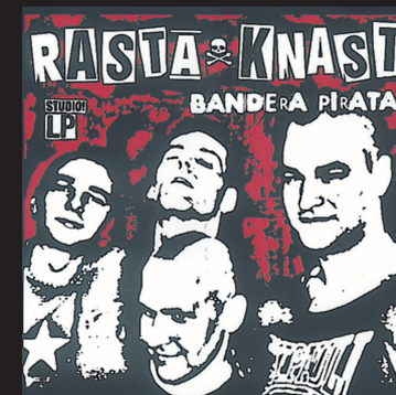
Rasta Knast Bandera Pirata