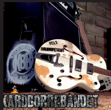
Kardborrbandet Helt inkomplett